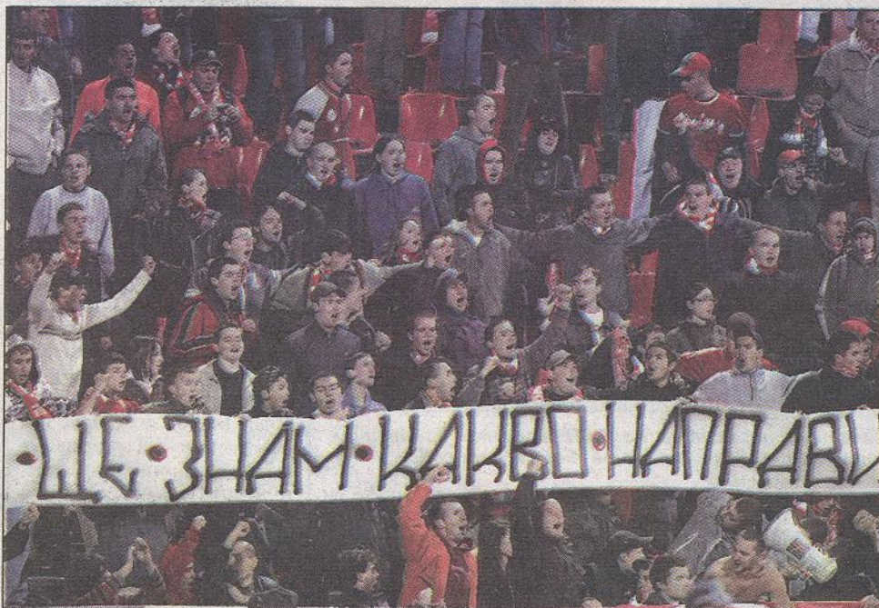
Сектор "Г" не трябва нито за момент да забравя откъде тръгва мръсният заговор срещу ЦСКА и да се бори до дупка срещу синята мафия