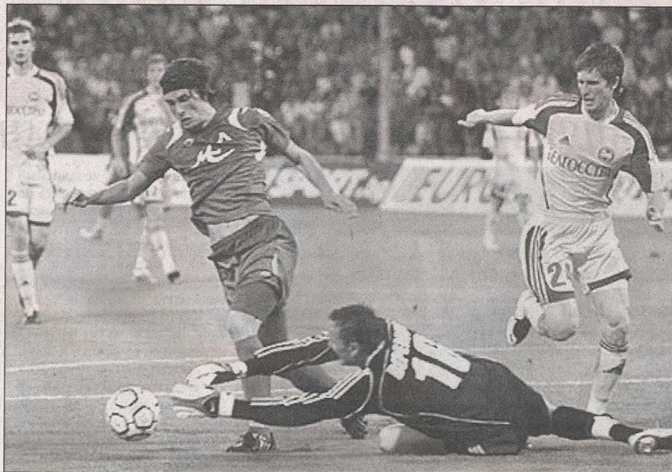
Ако беше играч на Левски, блестящият вратар на БАТЕ Веремко би получил безплатен билет за софийската баня от бате Бойко Борисов...

На всичко отгоре БАТЕ (наречен от испанската преса "най-слабият отбор в света") стартира в прословутите групи с минимална загуба - 0:2, на "Сантяго Бернабеу" срещу Реал, а бившият нападател на Спартак (Вн) Владислав Мирчев пропусна чисто положение при резултат 1:0. Да си припомним, че прехваленият тим на Левски под ръководството на Мъри Стойлов започна с 0:5 на "Ноу камп" срещу Барса, ка-